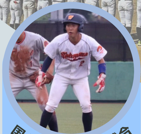
国公立大学親善試合

5校の国公立大学が四国に集まり、お互いに強化を図る「国公立大学親善試合」に参加しました。強豪私学を相手に、打ち勝っていくために、国公立大学同士で切磋琢磨し、2泊3日で3試合を行いました。秋季リーグ戦を迎えるにあたって見つかった課題を解決するために、日々練習やオープン戦に励んでいます。